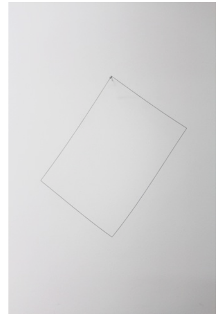
Vincent Dulom, Bord , 2015

Les fonds récoltés à l'occasion de cette vente permettront de poursuivre la numérisation des documents du fonds et de créer une nouvelle plateforme en ligne où seront regroupés tous les documents numérisés. La plateforme sera disponible en libre accès.