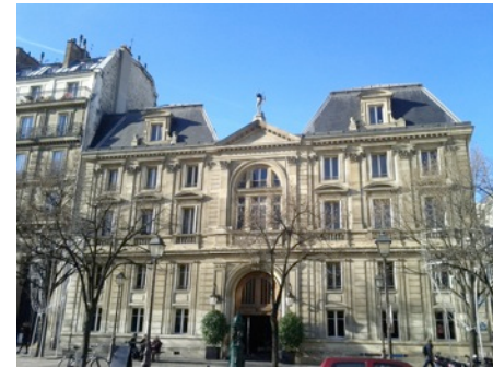
Hôtel de l'Industrie, Paris