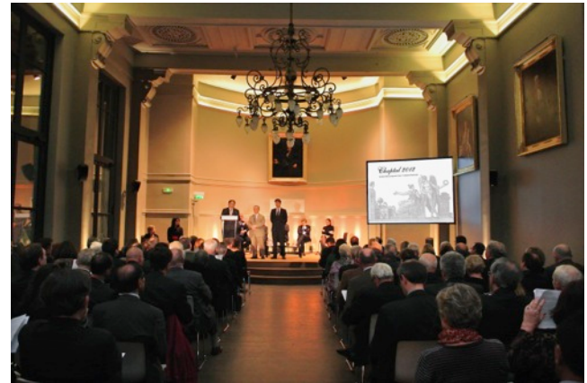
Salle Lumière, Hôtel de l'Industrie, Paris

A l'occasion de la Commemoration du Centenaire du Génocide Arménien , la galerie Sobering organise une vente aux enchères d'œuvres d'art contemporain au profit de l'association ARAM (Association pour la Recherche et l'Archivage de la Mémoire Arménienne) le jeudi 29 octobre à 19h30 à l'Hôtel de l'Industrie à Paris. La mise à prix de départ pour chaque œuvre sera de 200 €.