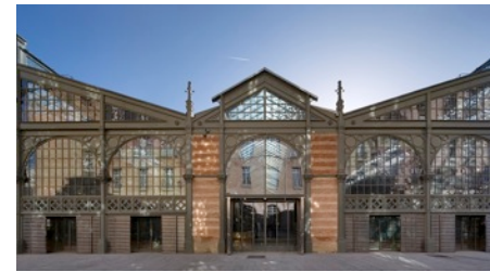
Carreau du temple, Paris