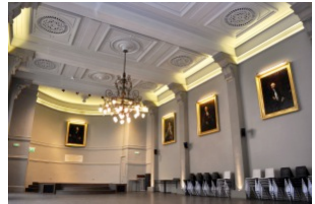
Hôtel de l'Industrie, Paris

L'intégralité de la soirée se déroulera à l'Hôtel de l'Industrie, 4, Place Saint-Germain-des-Près, 75006 Paris